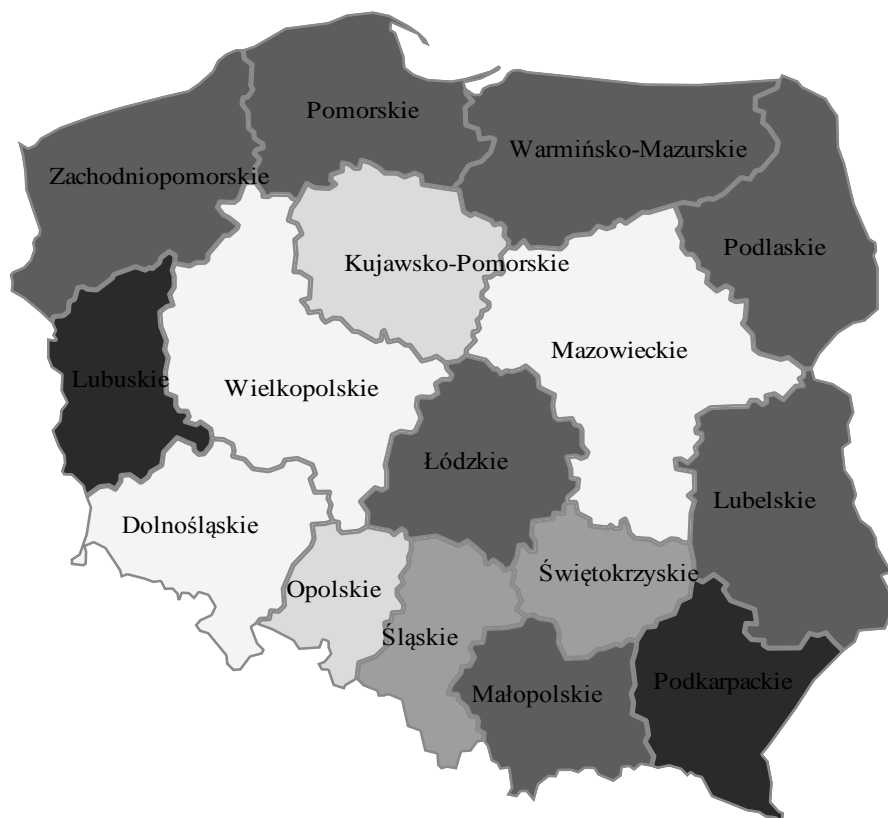
Rysunek 3. Przestrzenne rozmieszczenie grup województw

Przestrzenne rozmieszczenie wyodrębnionych grup województw przedstawiono na rysunku 3.