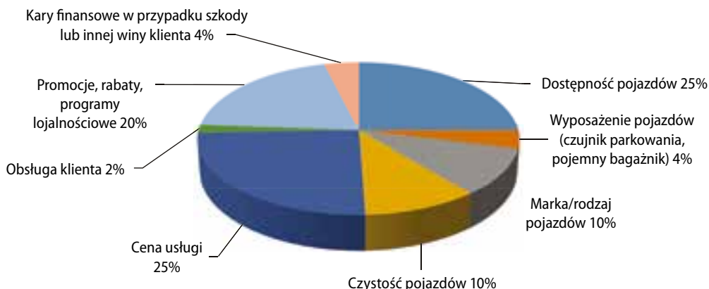
Rysunek 2. Istotność poszczególnych aspektów carsharingu wg respondentów

pojazdów” (19). Najmniej odpowiedzi (3) uzyskała „obsługa klienta”. Nikt z ankietowanych nie uznał „sposobu płatności za usługę” ani „warunków ubezpieczenia pojazdów” za jeden z trzech najważniejszych aspektów (rys. 2).